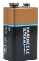
Voorbeeld 9 volt blokbatterij

Batterij service: Soms lukt het niet (meer) om zelf de batterij te vervangen. Op uw verzoek kunt u de batterij van uw rookmelder ook via de huismeester of technische dienst laten vervangen. Vraag bij de receptie naar de tarieven.