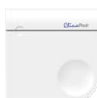
CO 2 -sensor

via de CO 2 -sensor (optioneel) (standaard instelling; 1.000 ppm)