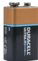
Voorbeeld 9 volt blokbatterij

Batterij service: Soms lukt het niet (meer) om zelf de batterij te vervangen. Op uw verzoek kunt u de batterij van uw rookmelder ook via de huismeester of technische dienst laten vervangen. Vraag bij de receptie naar de tarieven.