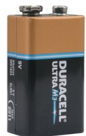
Voorbeeld 9 volt blokbatterij

Batterij service: Soms lukt het niet (meer) om zelf de batterij te vervangen. Op uw verzoek kunt u de batterij van uw rookmelder ook via de huismeester of technische dienst laten vervangen. Vraag bij de receptie naar de tarieven.